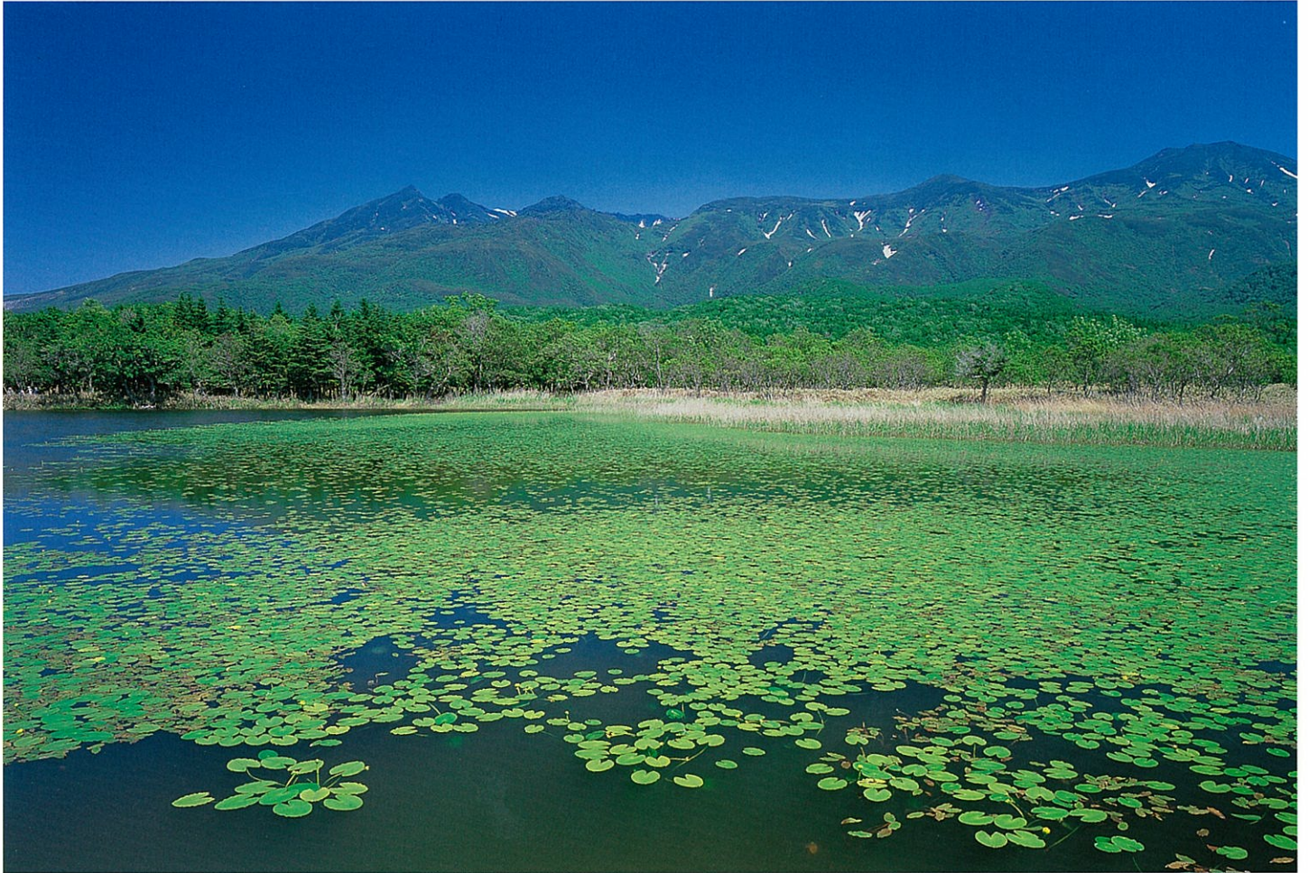
知床五湖と知床連山

札幌おおぞら法律事務所 〒060-0061 札幌市中央区南1条西10丁目 タイムスビル3階 TEL.011-261-5715 FAX.011-261-5705 E-mail:sapporo@ozoralaw.com