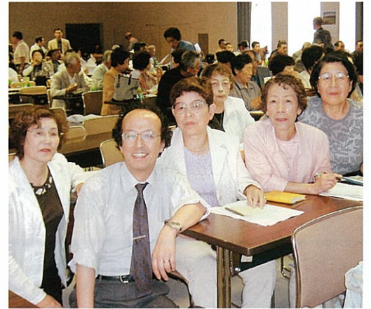
7月28日 最高裁勝利後の集會にて 原告のお母さんたちと